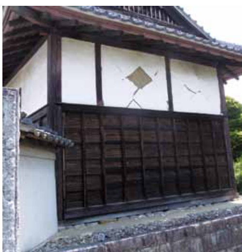
写真1 関東グループ/茨城県内の文化財被災調査

ては、一次調査で行われた国の登録文化財、二次調査で想定される県、市町村等の指定文化財の調査の他に、これらのリストにも含まれない、未来に文化として継承されるべき戦後のモダニズム建築などの被災調査も、今後の重要な課題であると認識しています。