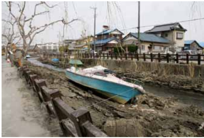
写真1 液化化で土砂にうまつた小野川