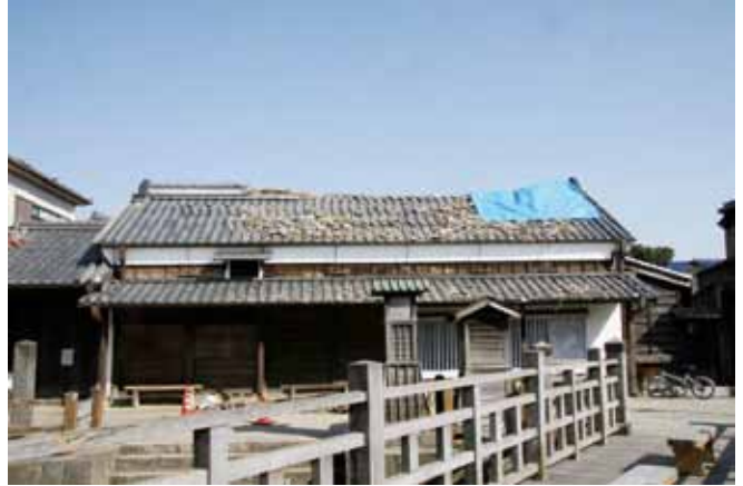
写真4 史跡の伊能忠敬旧宅