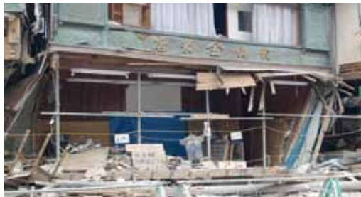
写真5 宮城県気仙沼市 1階部分が流失(津波被害) [4・5 撮影:野村俊一]