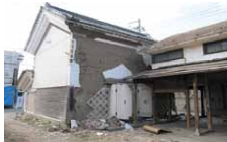
写真6 宮城県柴田郡村田町 土蔵の外壁崩落