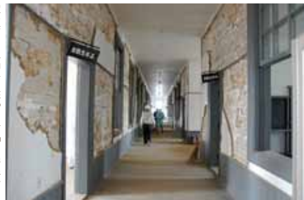
写真8 福島県郡山市「旧安積中 学校本館」内壁の剥落 [7・8 撮影:大山亜紀子]