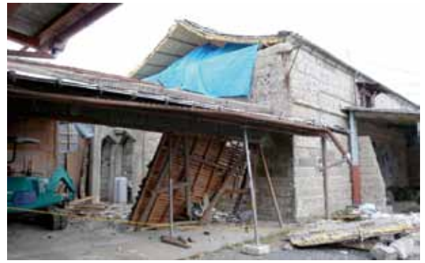
写真14 栃木県真岡市 大谷石蔵の妻壁崩落[13・14 撮影:上野勝久]