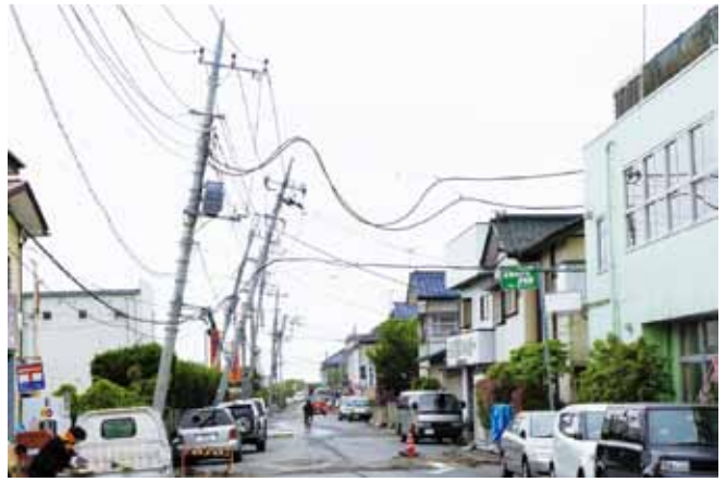
写真2 液化化のひどい市役所西側地区