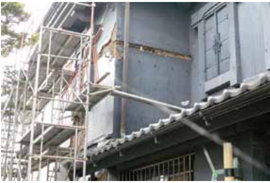
写真13 栃木県大田原市 土蔵造り建物の外壁部分破壊