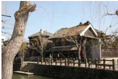
写真7 県指定の正上