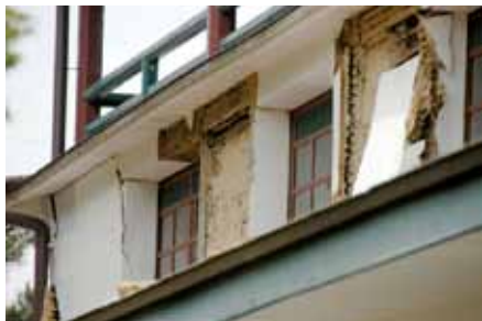
写真7 福島県郡山市「開成館」 土壁の部分破壊