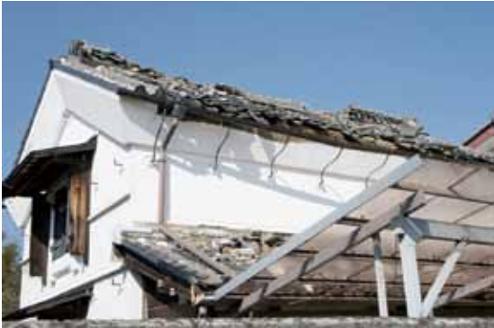
写真15 群馬県桐生市 土蔵の棟瓦崩落・屋根・下屋の破壊