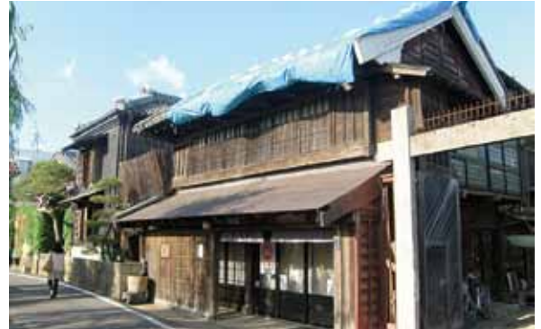
写真16 千葉県香取市佐原 土蔵造り町家の屋根瓦崩落[15・16 撮影:山崎鯛介]

栃木市は県内で最も多くの登録文化財（56棟）を抱え、蔵造りの伝統的町並みを構成しているため、やはり土蔵造りの建物（土蔵・見世蔵）に棟瓦の崩落、しっくい壁の亀裂・剥落などの被害が多く見られた。