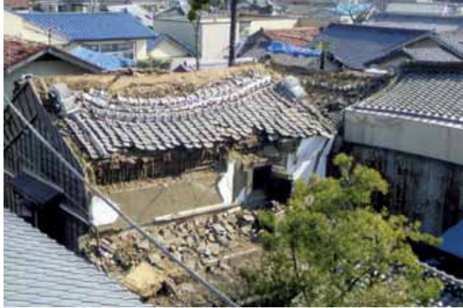
写真3 県指定の福新土蔵