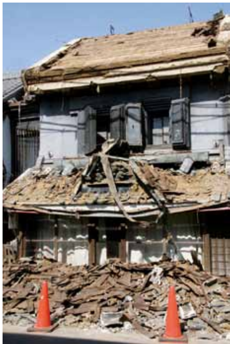
写真5 県指定の正文堂