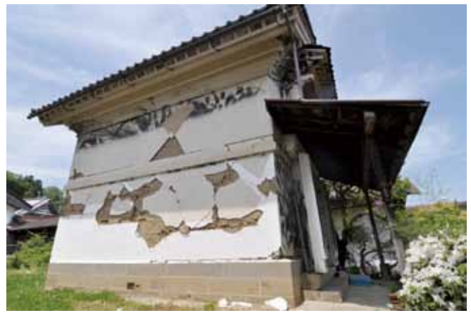
写真1 岩手県奥州市 土蔵の被害

今回の建築学会の調査では、主に未指定の文化財建造物、特に1996年に制度発足し、現在まで全国で8,300件以上を数えるに至った登録文化財建造物を中心に、建築学会建築歴史・意匠委員会が構築してきた「歴史的建築総目録データベース」にリストアップされている未指定文化財を対象とするとともに、調査員が極力現地に赴いて専門家の視点から被害状況を確認し、また調査シートに記録