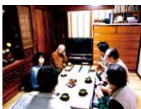
写真2 関東グループ/国登録文化財の被災調査(千葉縣市原市)。所有者より被災状況を伺う