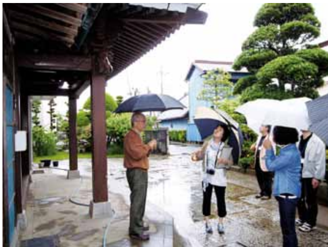
写真3 関東グループ/建築学会、JIAの合同被災調査(千葉縣市原市)