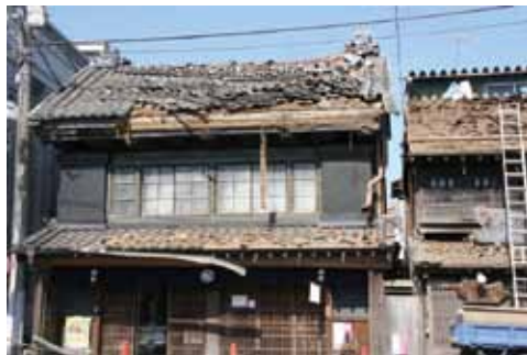
写真6 県指定の小堀屋