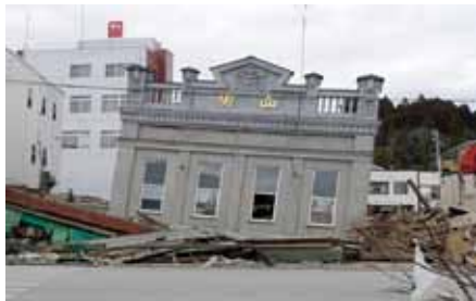
写真4 宮城県気仙沼市 1・2階部分が流失(津波被害)